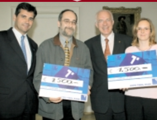
1. und 2. Platz